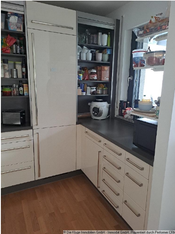
© Die Kluge Immobilien GmbH - Immodat GmbH. Präsentiert durch Perforce CRM