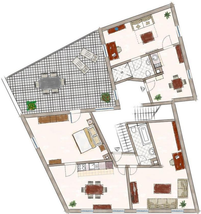
Exposéplan, nicht maßstablich