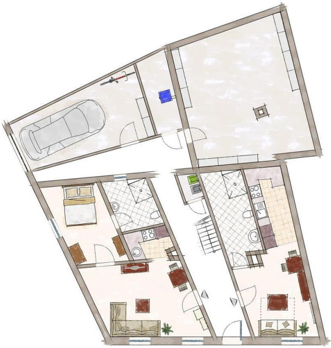
Exposéplan, nicht maßstablich